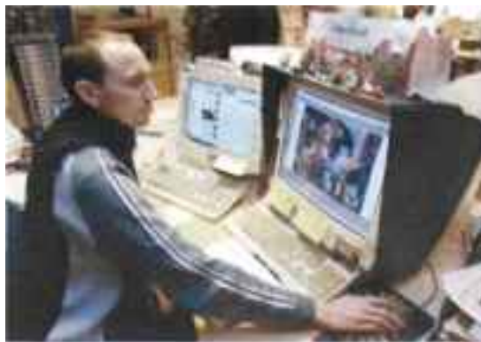
REMOS GODE HJELPERE: Har gitt nytt liv til ufattelige 330.000 filmruter.