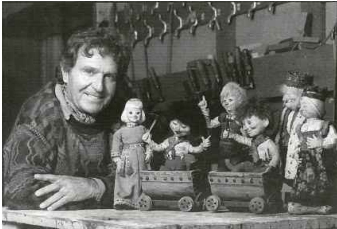
HISTORISK MØTE: Karius og Baktus møter Askeladden.