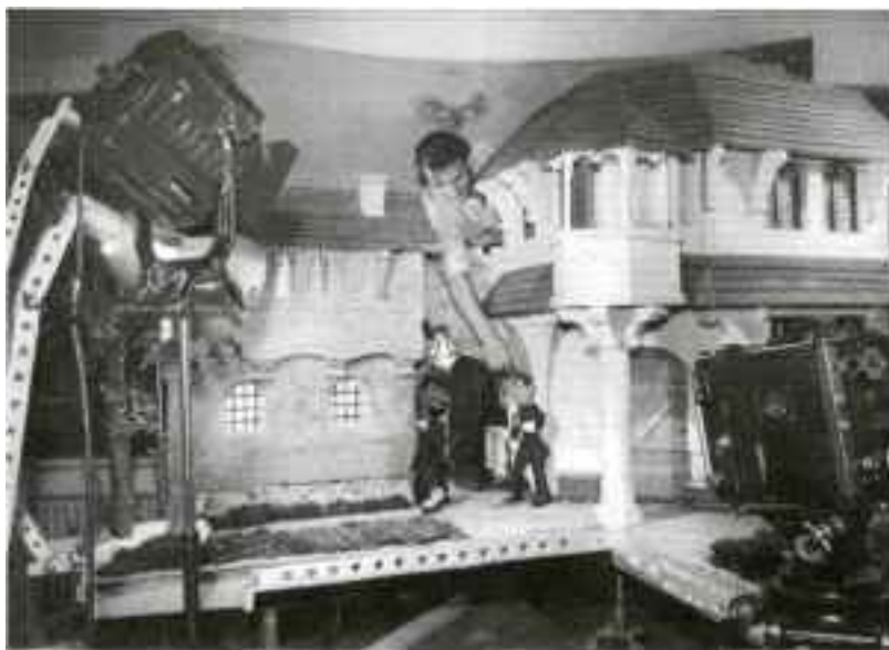
I STUDIO: Ivo Caprino i arbeid med sin debutfilm, «Tim og Tøffe», i 1949.