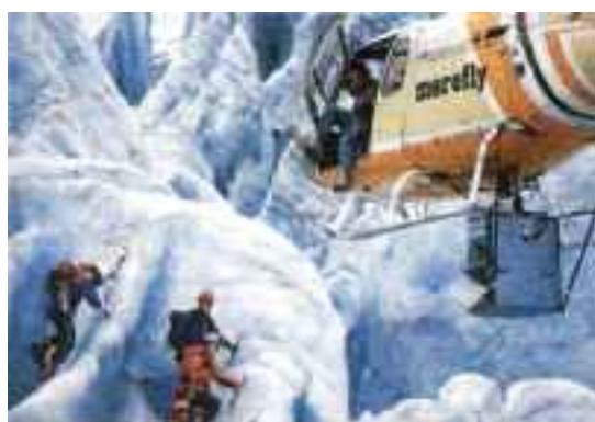
I BREHEIMEN: Med sitt eget supervideografkamera skapte Ivo Caprino en helt ny filmopplevelse.