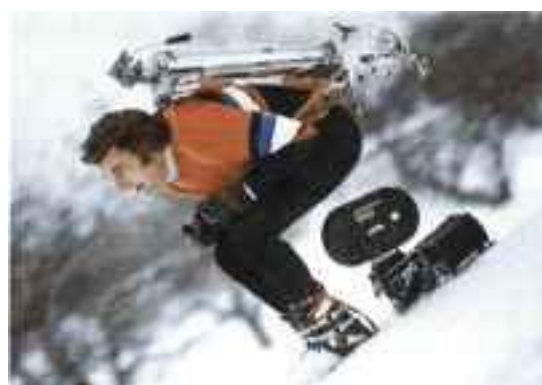
KAMERA GÅR: Ivo Caprino var villig til å gjøre det meste for å få «action» i filmene sine.