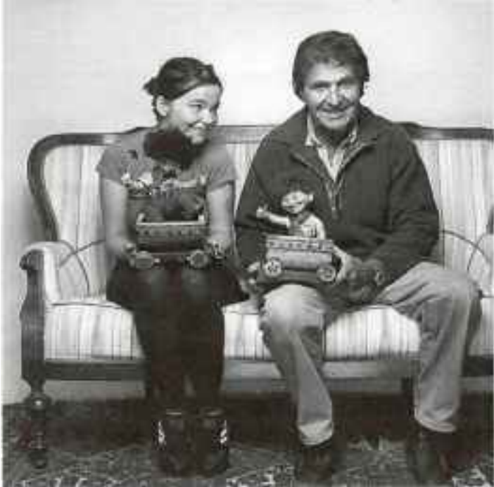
CAPRINOFAN: Superstjernen Bjørk, dypt beæret over å få møte Ivo Caprino.