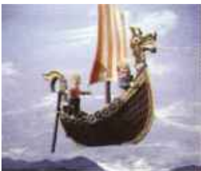
PRAKTISK SKUTE: Som kan gå like godt til lands som til vanns.