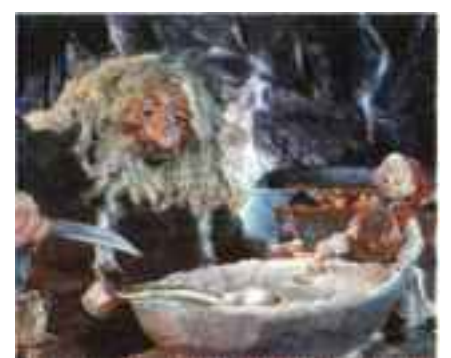
SIJEBNESYNGERT MÅLTID: Askeladden lærer trollet hvordan han skal få plass til litt mer grøt.