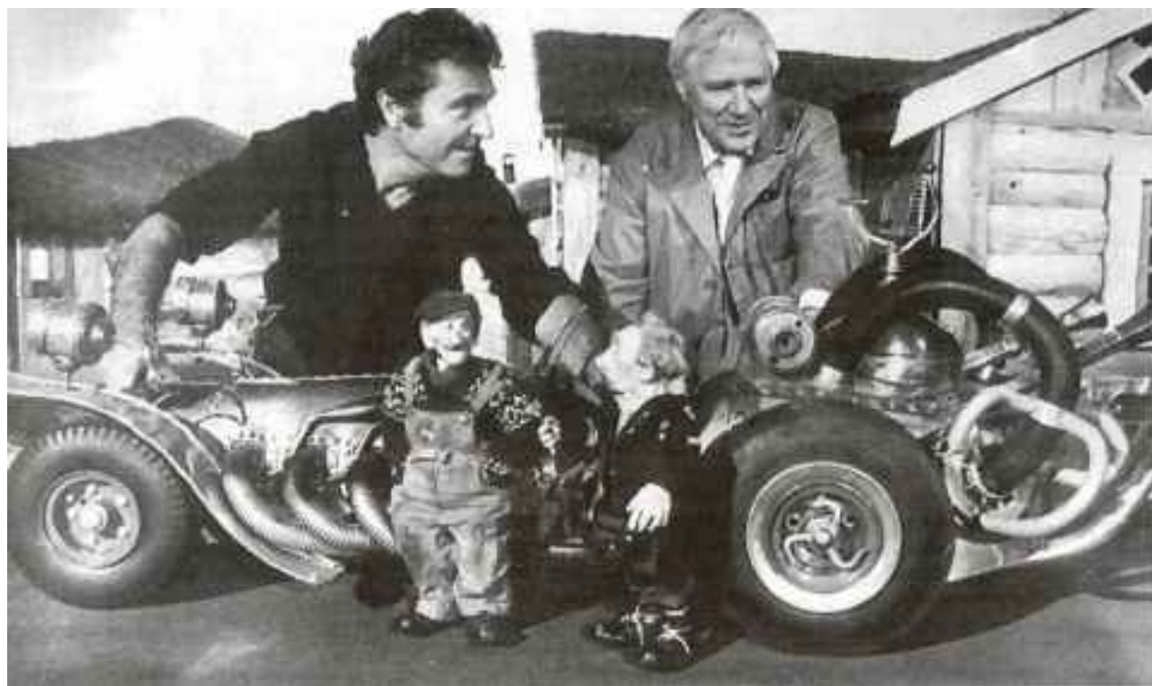
DREAMTEAM: Ivo Caprino og Kjell Aukrust. Sammen skapte de tidenes mest populære norske spillefilm.