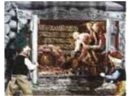
VÄRMERE ENN I GLOHAUGEN: Askeladden og de gode hjelperne hans stenges inne i badstua.