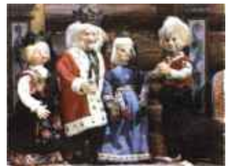
UØNSKET SVIGERSONN: Kongen er ikke begeistret over å få Askeladden på besøk.