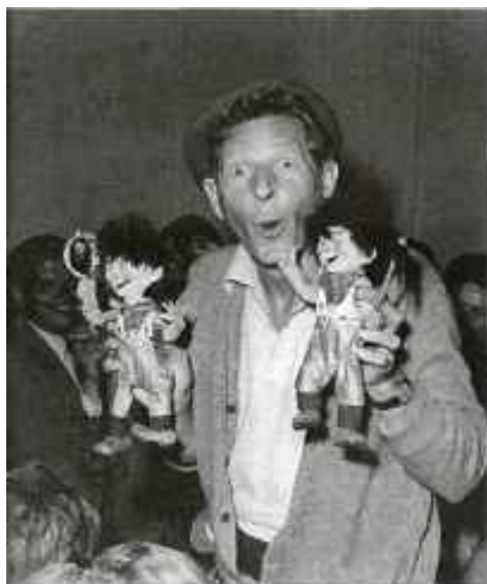
TRE RAKKERUNGER: Karius, Danny Kaye og Baktus.