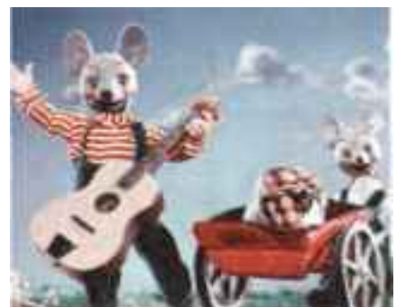
GODE VENNER: Her kommer Klatremus Lillemann og Morten Skogmus.