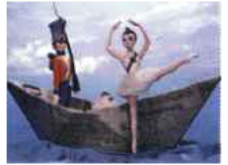
STRUNK KAVALER: Den standhaftige tinnsoldat og hans elskede danserinne.